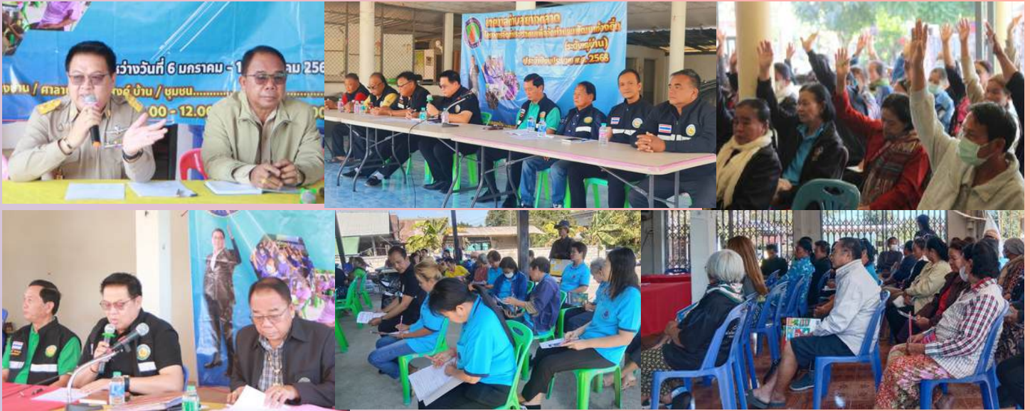
การประกวดรางวัล (อปท.) ที่มีการบริหารจัดการที่ดี

โครงการประชุมประชาคมหมู่บ้านทั้ง 9 หมู่บ้าน 10 ชุมชน