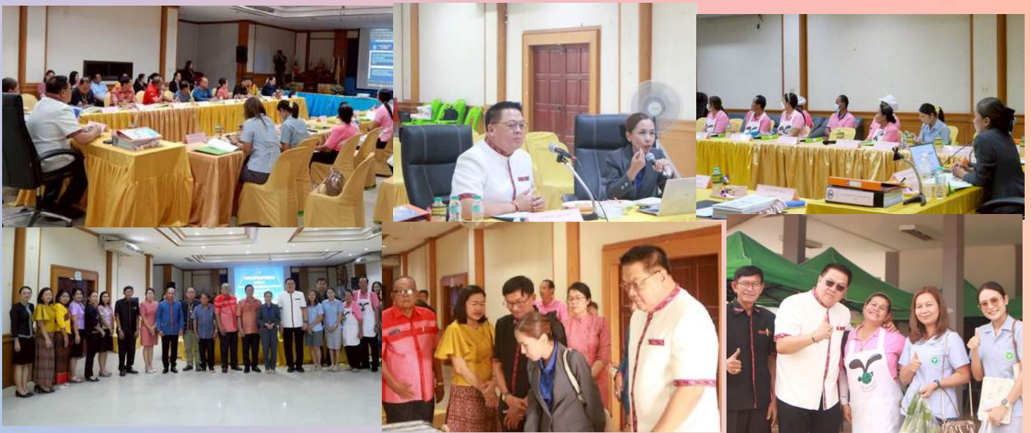
ประชุมคณะกรรมการสนับสนุนการจัดทำแผนพัฒนาเทศบาล