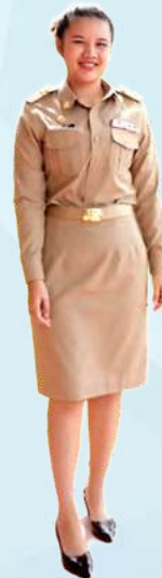
5 นางสาวพัชรินทร์ สมศรี สมาชิกสภาเทศบาล